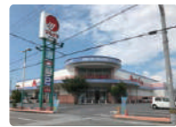
マルナカ伊予店 分譲地から車で約5分