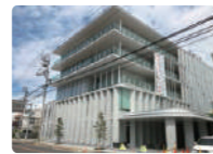
伊予市役所 分譲地から車で約10分