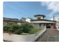
伊予鉄道郡中線「郡中港駅」 分譲地から徒歩約10分