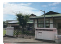
なかむら保育所 分譲地から車で約5分