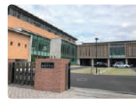
港南中学校 分譲地から徒歩約15分