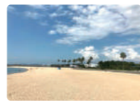
五色浜公園 分譲地から徒歩約5分