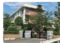
北山崎小学校 分譲地から徒歩約15分