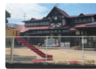
北山崎幼稚園 分譲地から車で約5分