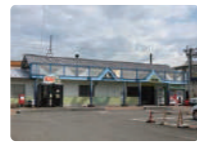
JR予讃・内子線「伊予市駅」 分譲地から徒歩約10分